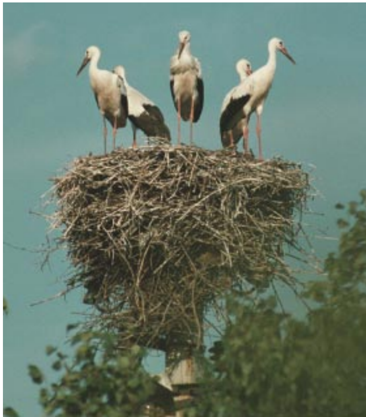
Чи буде куди повертатися з вірію?