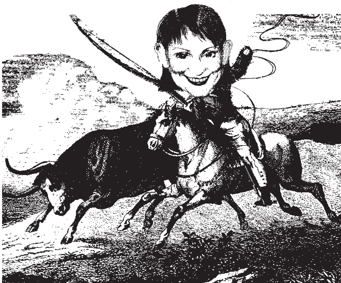
Рисунк Volodymyra KOSTYRKA