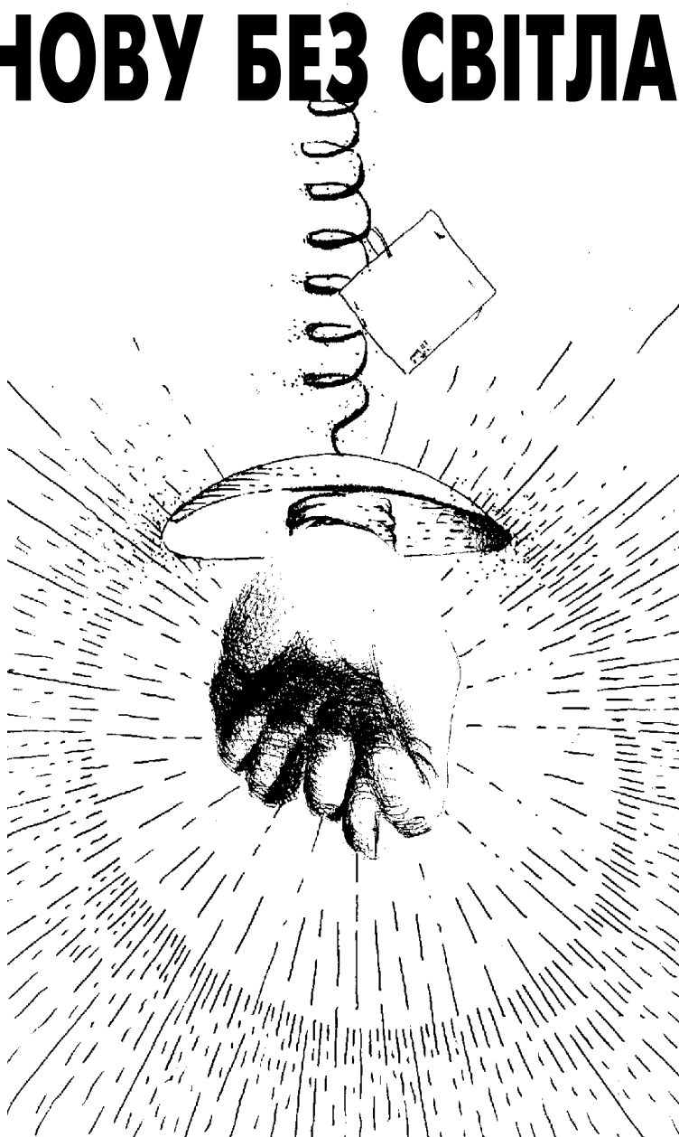
Rysunok Volodymyra KOSTYRKA