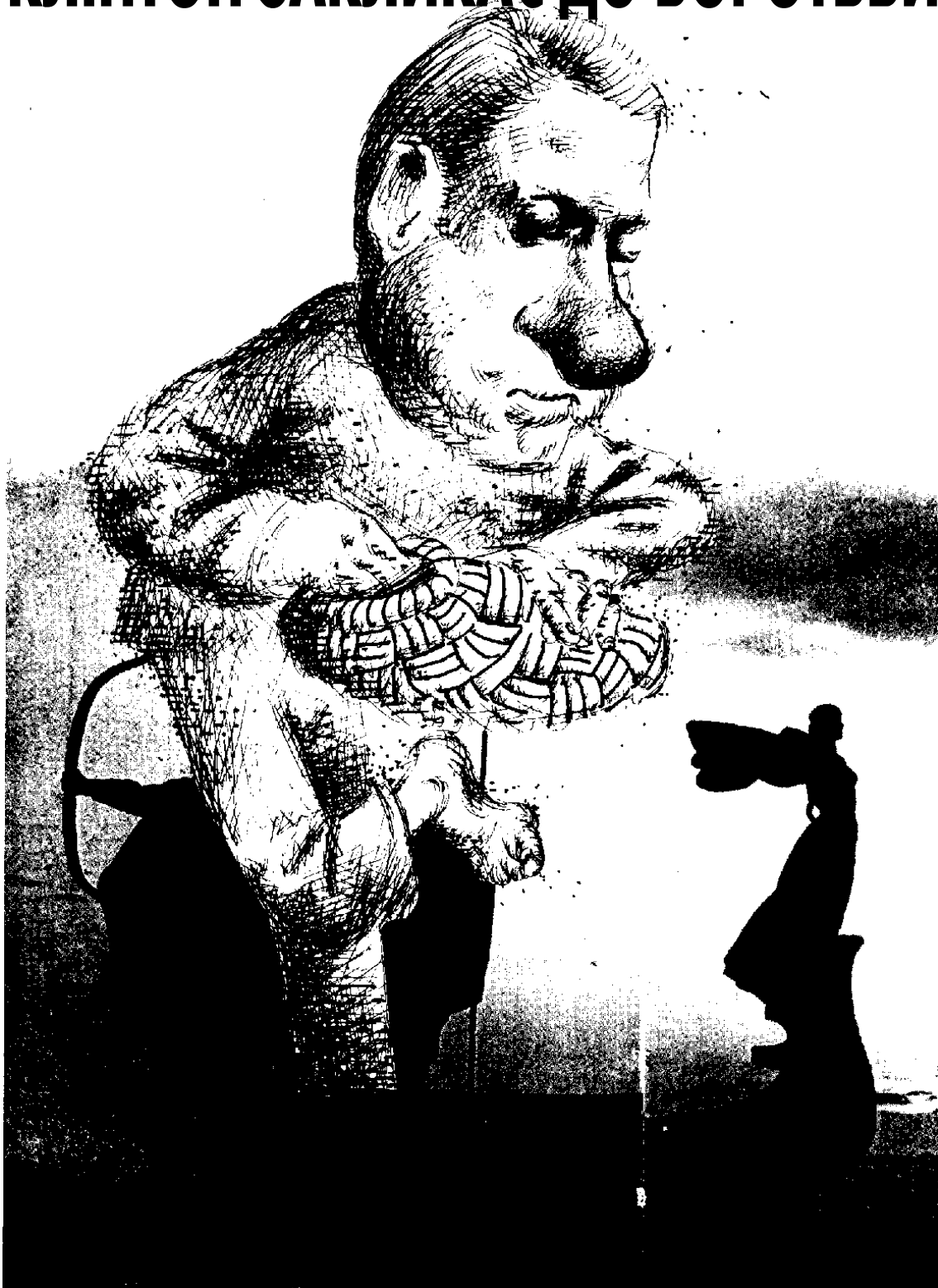
Рисунок Volodymyra KOSTYRKA