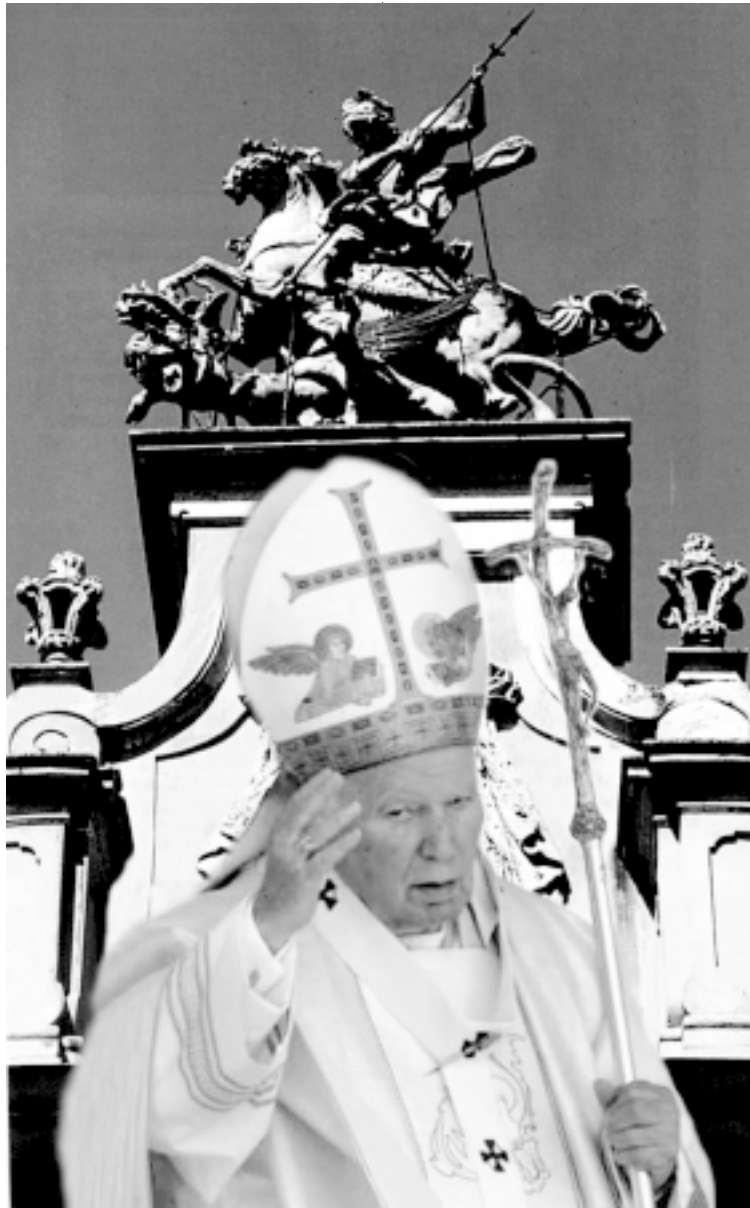
Колаж Jurka BANZAJA

На форум прибули понад 200 бізнесменів і політиків із обох країн, аби обговорити питання двосторонньої економічної співпраці й вирішити проблеми, які стоять цьому на заваді. Останні роки були не найкращими для торгівлі між двома країнами. Економічна криза в Росії та викликане нею падіння курсу гривні зробили польські товари для нас надто